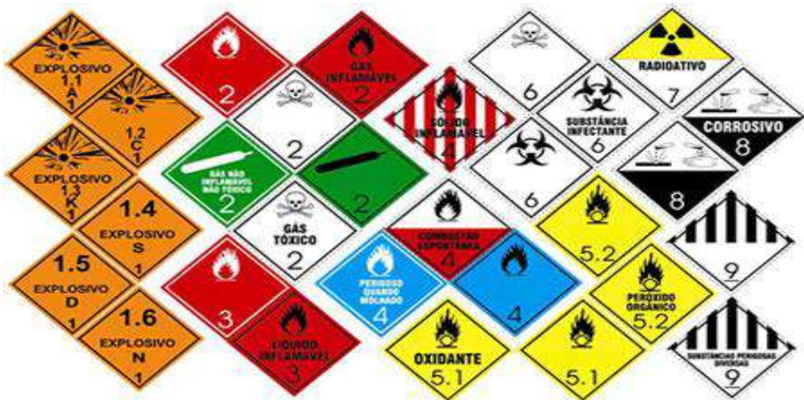
Figura - Placas de sinalização de materiais perigosos

A identificação no veículo transportador é feita através de retângulos laranjas, figura 10.1 que podem ou não apresentar duas linhas de algarismos, definidos como Painel de Segurança; e losangos definidos como Rótulos de Risco, que apresentam diversas cores e símbolos, correspondentes à classe de risco do produto a ser identificado.