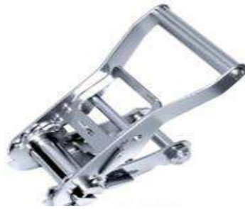
Figura 3.1 - Catracas

Catracas - é um dispositivo mecânico, vide figura 3.1, que permite transferir a tensão de um ponto à outro. São utilizadas para tracionar as Cintas de Poliéster e Cintas Têxteis no geral permitindo a transferência da tensão para a cinta de amarração.