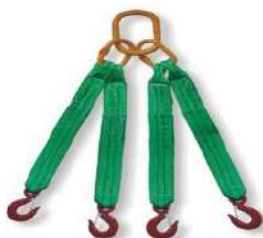
Figura 3.7 – Eslinga de cintas.

Eslinga ou linga – conjunto de estropos de cabo ou corrente, vide figura 3.7, utilizado para içar ou arriar cargas pesadas.