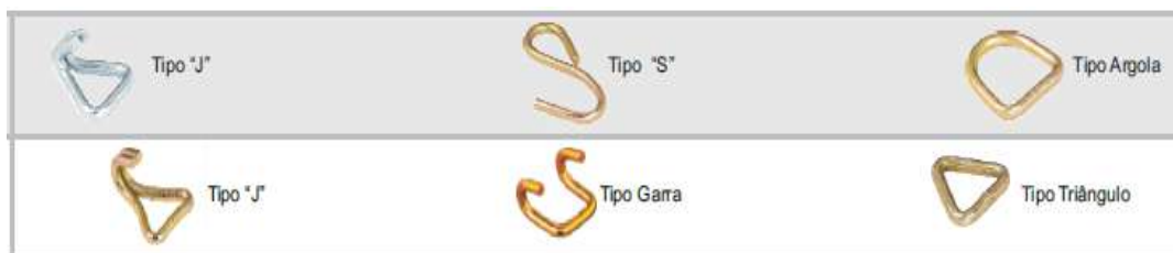
Figura 3.5 - Exemplos de terminais.

Terminais - são peças instaladas nas extremidades dos cabos de aço, vide figura 3.5, para interligá-los com outras partes ou acessórios de um sistema de movimentação de cargas.