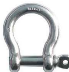
Figura 3.4 - Manilha

Dispositivos de canto (gatos, fechos de torção e manilhas) - são peças padronizadas, vide figura 3.4 e que servem, não só para movimentação, mas também para a peaço do contêiner.